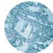
Leitungswasser ohne Behandlung